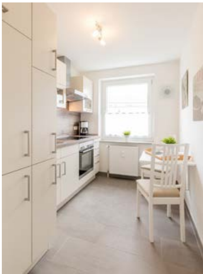
Küche und Wohnbereich der Gästewohnung Welfenallee 29